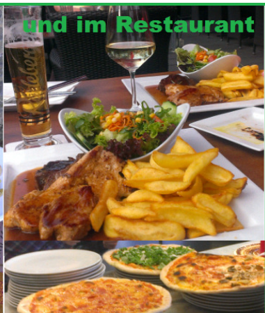
und im Restaurant