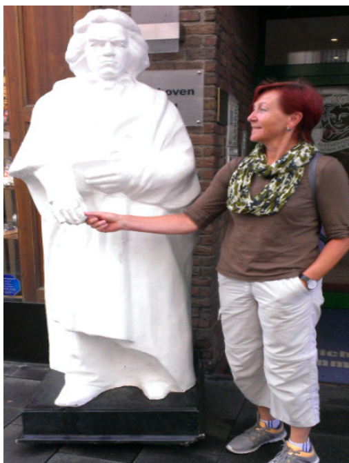
ein wenig Kultur