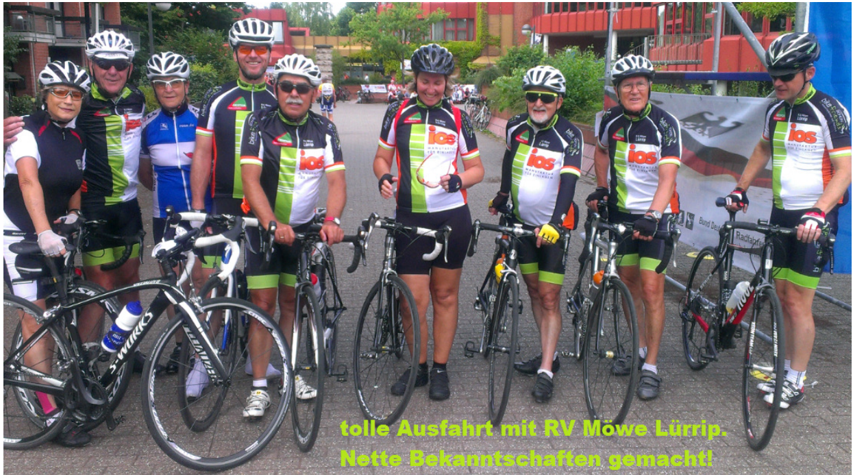
tolle Ausfahrt mit RV Möwe Lürrip. Nette Bekanntschaften gemacht!