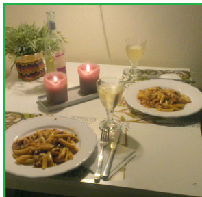
lecker gespeist, zu Hause,