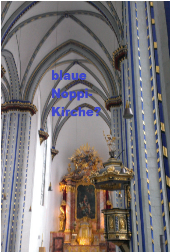
blaue Noppi- Kirche?